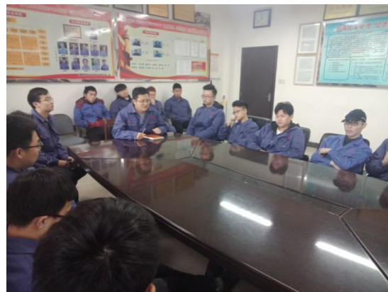
实习学生进行安全知识教育