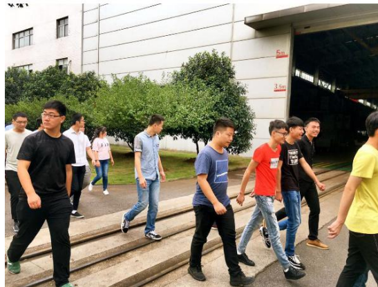
新生进行认知实习

公司于 2017 年与我院进行校企合作，主要提供数控车、铣、加工中心的机械零件加工、编程、工艺设计、数控机床故障诊断、设备维护与保养等认知实习、校外实训和顶岗实习。