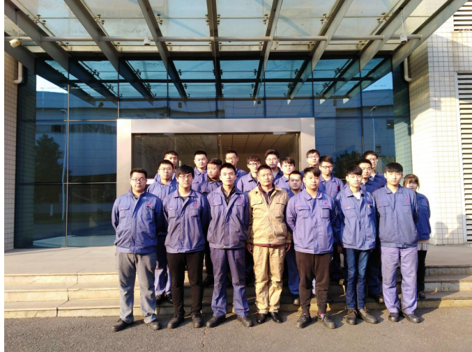
教师跟踪回访实习学生